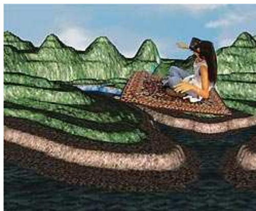
Tapete mágico: realidade virtual tem ampla aplicação em salas de aula, como no estudo do ciclo da água (acima)

Há um centro de aprendizagem interativa, com todas as informações digitalizadas, onde um especialista em multimídia assessora os alunos. Os computadores pessoais têm programas que monitoram a velocidade com que os estudantes estão aprendendo as lições. Se o jovem avança rápido, é estimulado a acelerar ainda mais. Se não vai bem, professores são destacados para ajudá-lo. O colégio de Bill Gates, um crítico da obsolescência das escolas americanas, tem 170 alunos – o número de estudantes pode chegar a 700 –, a maior parte proveniente de família de baixa renda. No Brasil, são as escolas particulares que ampliam rapidamente o arsenal de recursos tecnológicos empregados nas classes. A maior parte dos colégios de primeiro time já conta com especialistas nesse campo. "É preciso se preparar para essas novidades, pois tecnologia pela tecnologia vira pirotecnia; não serve para nada", diz o consultor Ronaldo Carvalho.