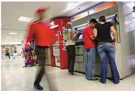
Segurança: a inteligência artificial tem sido incorporada aos cartões