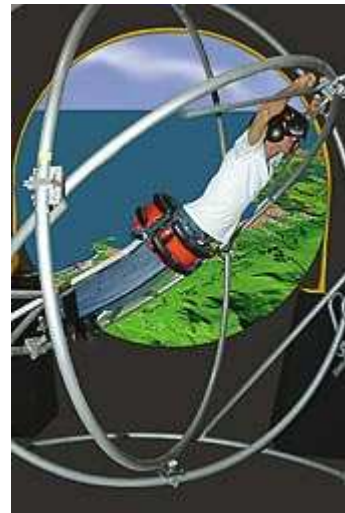
Classe virtual: o giroscópio Ícaro, do Objetivo, simula vôo em asa-delta sobre o litoral paulista

Novos recursos tecnológicos também estão sendo levados diretamente às salas de aula. Exemplos em profusão desses equipamentos podem ser vistos na escola do futuro idealizada pela Microsoft e inaugurada em setembro na Filadélfia, nos Estados Unidos. Em um edifício high-tech, os adolescentes guardam o material em armários com cadeados digitais e controlam eletronicamente as calorias que consomem na lanchonete. Ninguém carrega livros. Cada estudante tem um laptop, no qual faz as anotações da aula, grava arquivos com as exposições dos professores e navega na web – uma rede sem fio (wireless) está disponível em todo o edifício.