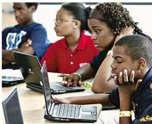
A escola do futuro, criada pela Microsoft, na Filadélfia: alunos usam notebook em vez de caderno

Cursos de e-learning aplicados à formação acadêmica alcançam perto de 1,3 milhão de brasileiros. O número de instituições que proporcionam aulas desse tipo passou de 166, em 2004, para 217 no ano passado. Nos Estados Unidos, mais de dois terços de todas as entidades de ensino superior oferecem cursos on-line. Anualmente, cerca de 18% dos alunos universitários americanos frequentam salas de aulas virtuais. O Canadá tem 500 000 estudantes na mesma situação; a Europa, 900 000; e a Ásia, 3 milhões.