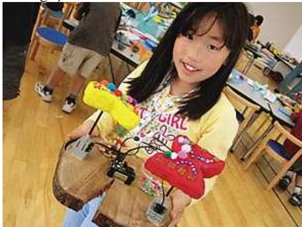
Garota mostra um Cricket, brinquedo que confere capacidade de processamento a sucatas